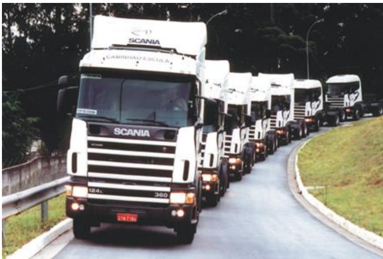
Frota Caminhão Escola