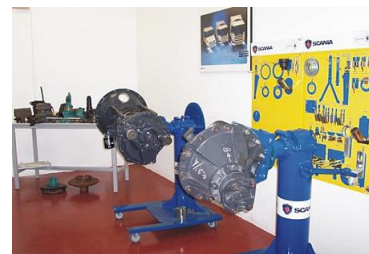
Laboratório Caixa e Diferencial