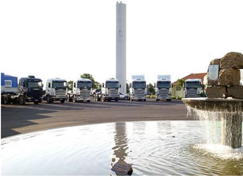
Caminhões Scania - Equip. Randon entregues à Fabet