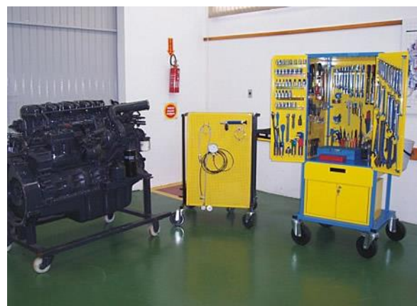
Laboratório de Mecânica/Exposição de Motores