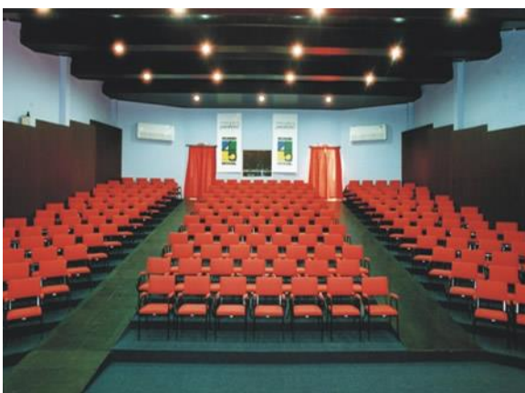
Auditório para 250 pessoas