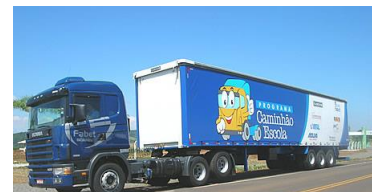
Caminhão Escola versão 2004